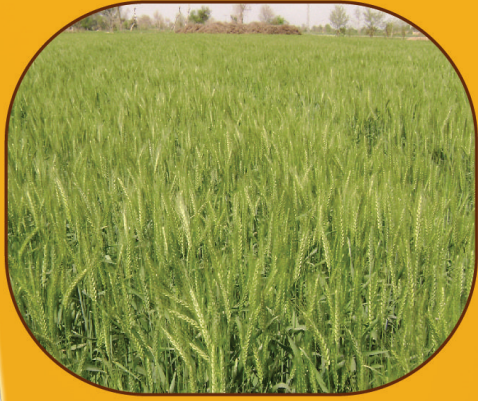
ٹاپ ویٹ سے اسپرے شدہ فصل