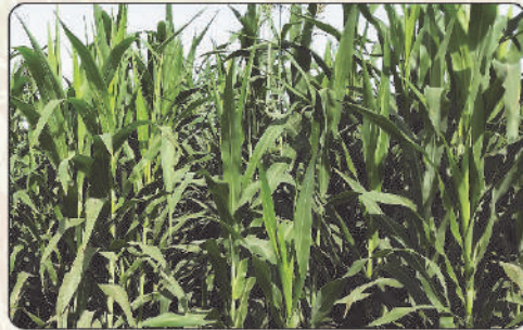
نوٹ: کاشتکار حضرات مقامی موسم کے مطابق وقت کاشت کا تعین کریں۔

پاکستان دودھ کی پیداوار میں چوتھے نمبر پر ہے اور سالانہ ملکی دودھ کی پیداوار تقریباً 6 کروڑ ٹن ہے۔ اس کے باوجود پاکستان ہر سال 20 ارب روپے دودھ اور ڈیری مصنوعات کی درآمد پر خرچ کرتا ہے۔ ضرورت اس امر کی ہے کہ دودھ کی ملکی پیداوار کو بڑھایا جائے۔ ڈیری ماہرین کے مطابق منافع بخش ڈیری فارمنگ کیلئے کسی بھی ڈیری فارم پر جانور کی اعلیٰ نسل اور جانوروں کی بہترین نگہداشت کے ساتھ اعلیٰ معیار اور غذائیت سے بھرپور چارے کی فراہمی بھی بہت ضروری ہے۔