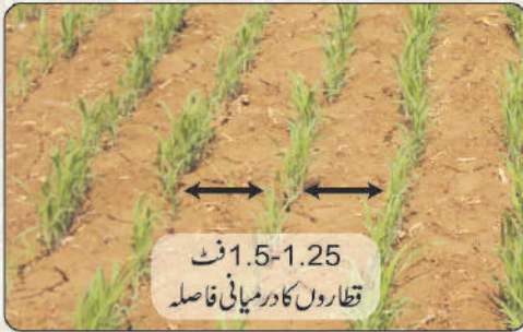
1.25-1.5 فٹ قطاروں کا درمیانی فاصلہ

بہترین پیداوار کے لئے جمبو کو جہاں تک ممکن ہو سکے قطاروں میں کاشت کریں۔ مطلوبہ 6-5 کٹائیوں کے حصول کیلئے گندم والی ڈرل (ریج ڈرل) کی ایک نالی بند کر کے قطار سے قطار کا مطلوبہ فاصلہ تقریباً 1.5 فٹ حاصل کیا جاسکتا ہے۔