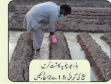
پودے سے پودے کا فاصلہ 9-8 فٹ