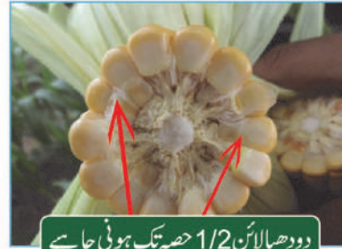
دودھیالائن 1/2 حصہ تک ہونی چاہیے

دانے کے سرے پر کالا نشان نظر آنے لگے اور جھلیوں کے پردے خشک ہو کر لٹک جائیں۔ سالیج کیلئے اس وقت فصل برداشت کریں جب دانے کی دودھیالائن دانے کے 1/2 حصہ پر پہنچ جائے۔