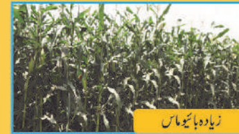
زیادہ ہائیو ماس