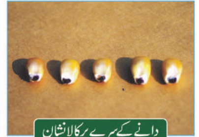
دانے کے سرے پر کالا نشان

نوٹ: کھیتی صرف بیج کے آگے اور خالص بن کی ضمانت دیتی ہے۔ پیداوار کا انحصار بہت سے قدرتی عوامل پر منحصر ہے اس لئے پیداوار میں کمی بیشی کی کھیتی ذمہ دار نہ ہوگی۔