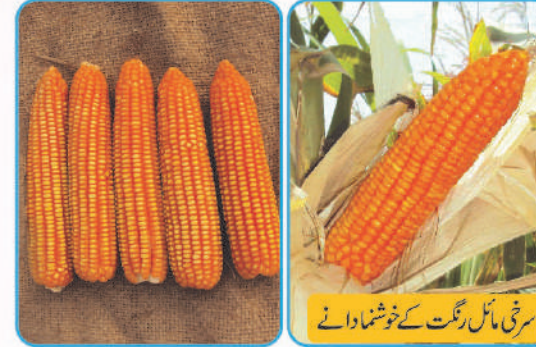
سُرخ مائل رنگت کے خوشنما دانے