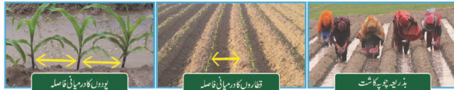
پودوں کا درمیانی فاصلہ