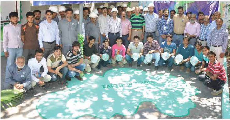
EARTH DAY PLEDGE