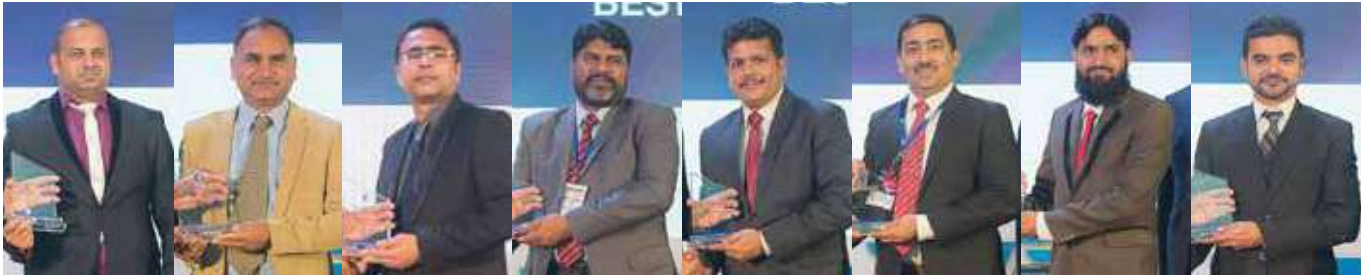
بہترین پرفارمنس ایوارڈ ونرز - ایگری ڈویژن