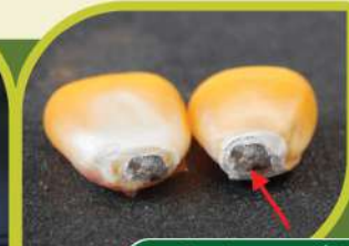
دانے کے سرے پر کالا نشان

نوٹ: کمپنی صرف بیج کے اگنا اور خالص پن کی ضمانت دیتی ہے۔ پیداوار کا انحصار بہت سے قدرتی عوامل پر منحصر ہے اس لئے پیداوار میں کمی کمپنی ذمہ دار نہ ہوگی۔