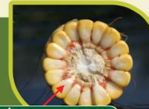
دو دھلیا لائن 1/2 حصہ تک ہونی چاہیے

دانے کے سرے پر کالا نشان نظر آنے لگے اور چھلیوں کے پردے خشک ہو کر لٹک جائیں۔ سائیج کیلئے اس وقت فصل برداشت کریں جب دانے کی دو دھلیا لائن دانے کے 1/2 حصہ پر پہنچ جائے۔